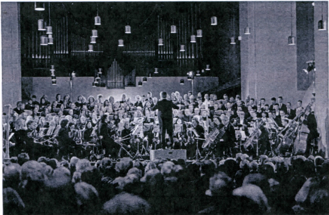
1. Aufführung, 14.3.15, Kornelimünster